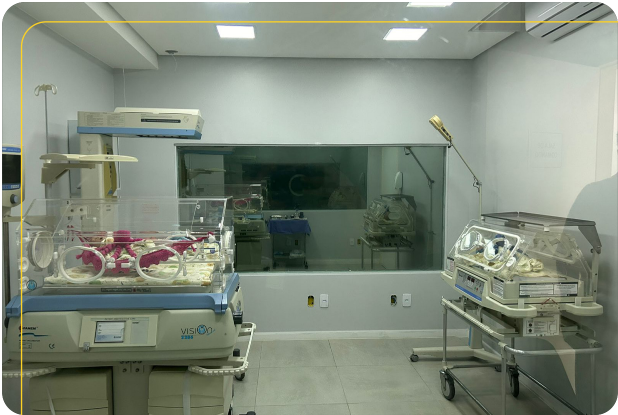
Laboratório de Simulação Realística